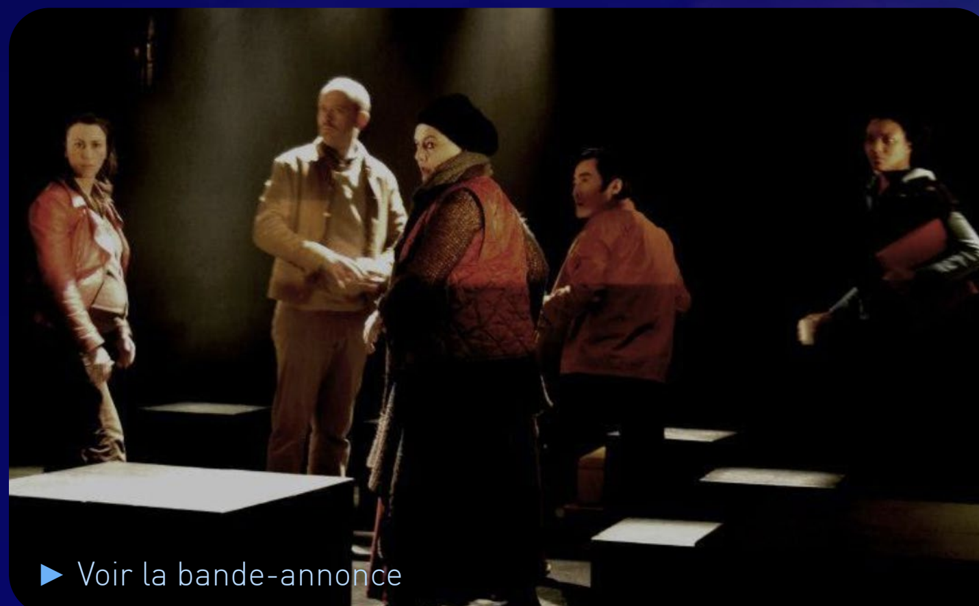
► Voir la bande-annonce

Dans la salle d'attente d'un mystérieux institut, six personnages s'observent, inquiets. Takumi, Melissa, Alma, Gabriel, Serge et Sophie n'ont en commun, ni leurs origines, ni leurs parcours. Cependant chacun porte le poids de l'absence et souhaite conserver la trace unique et intime d'un disparu, d'un être aimé.