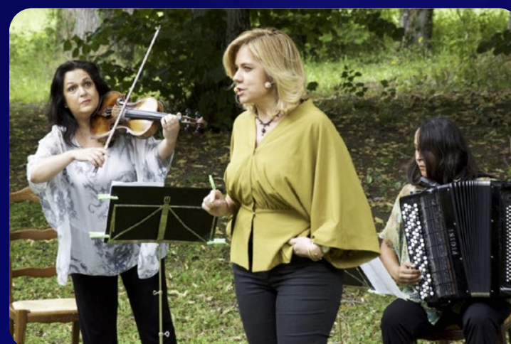
► Voir la bande-annonce